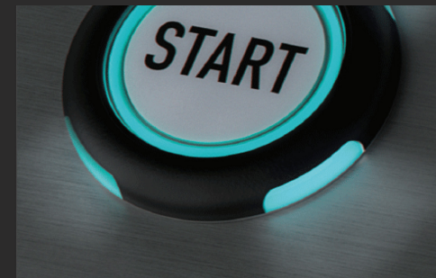
明るさや感度を自由に設定可能