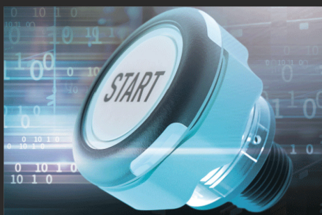
スイッチ時の動作を 自由にプログラミング