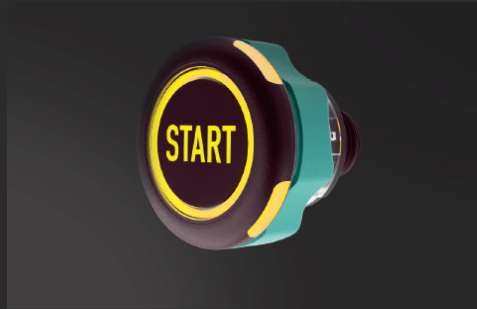
視認性が高く操作性が良い